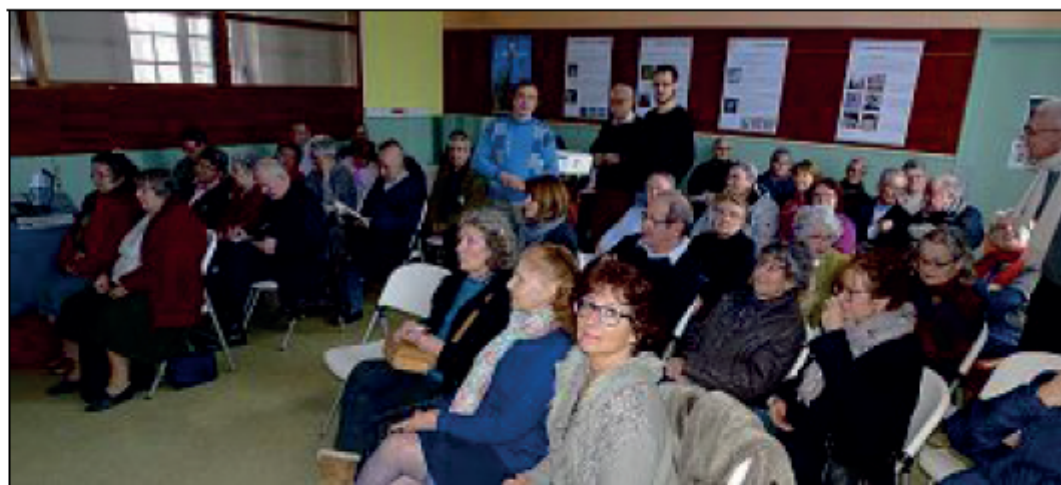
ASSEMBLÉE GÉNÉRALE. De plus en plus de personnes s'intéressent au patrimoine et à l'histoire, et le nouveau site internet du Ghamy va apporter de nombreuses réponses.